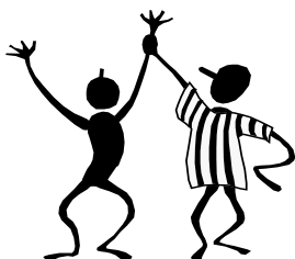
1.att. Attēla nosaukums (atsauce uz informācijas avotu, ja tāds ir).